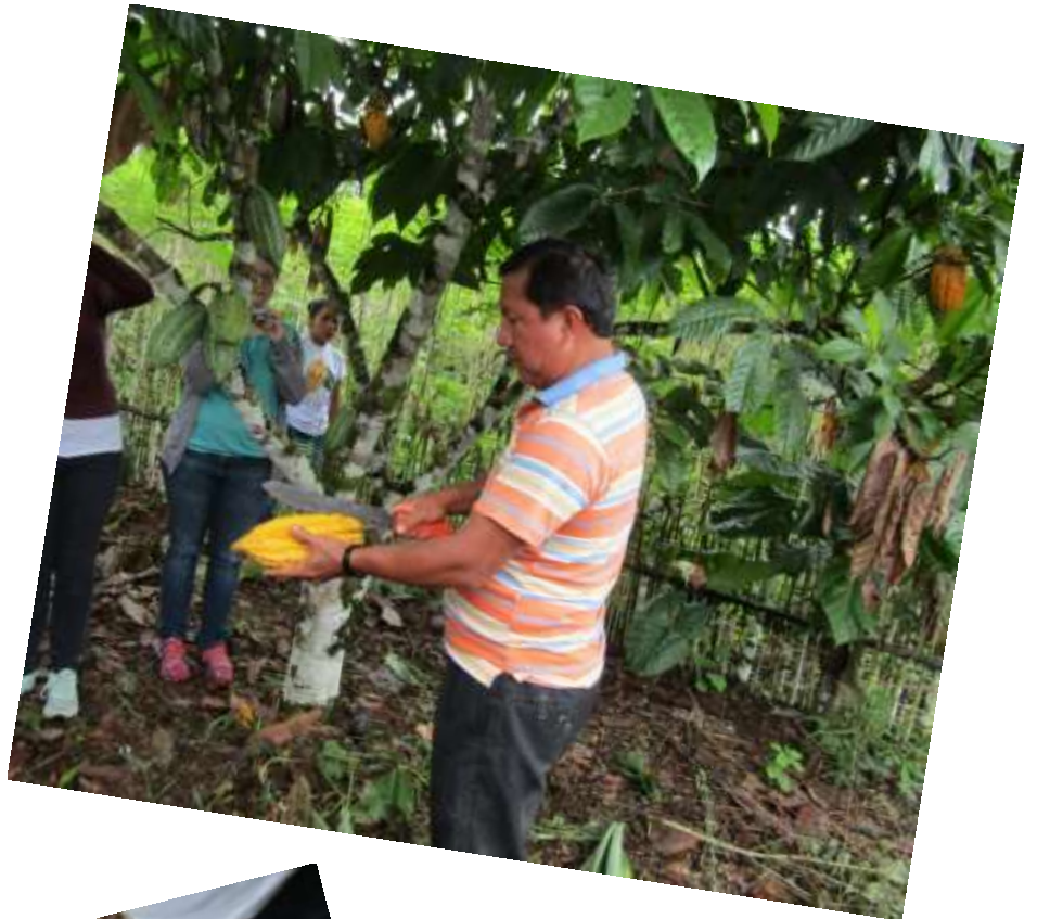
Weiter auf der Kakao-Plantage