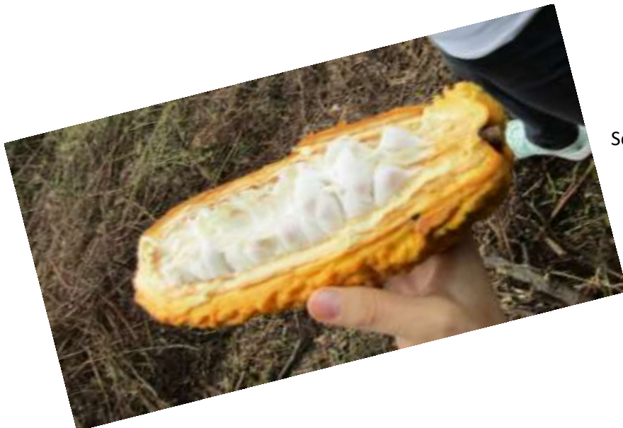
So sieht die frische Frucht dann geöffnet aus