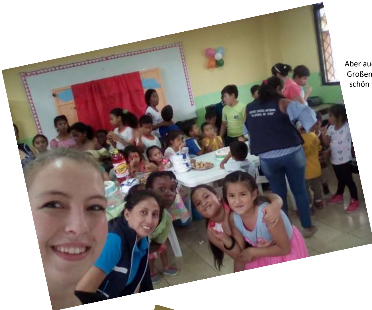
Aber auch bei den Großen war ganz schön was los!