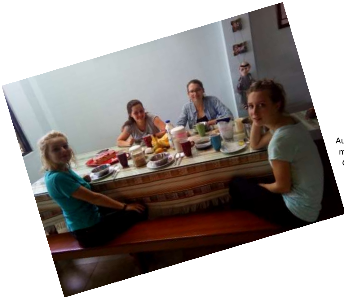
Auch wenn's schon zwölf mittags war: Mein Geburtstags-FRÜHSTÜCK!!!!