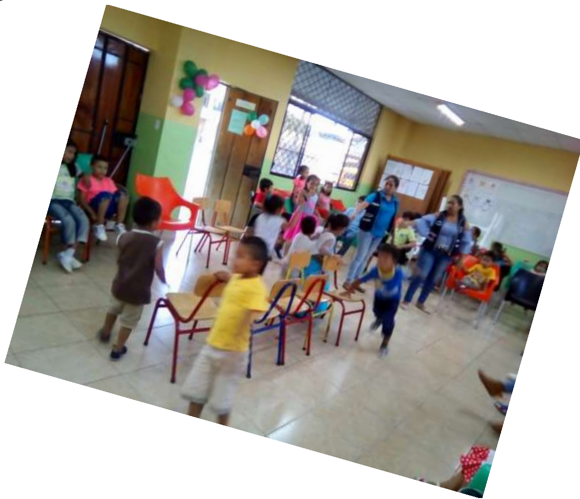
Reise nach Jerusalem darf natürlich auf keinem Fest fehlen!