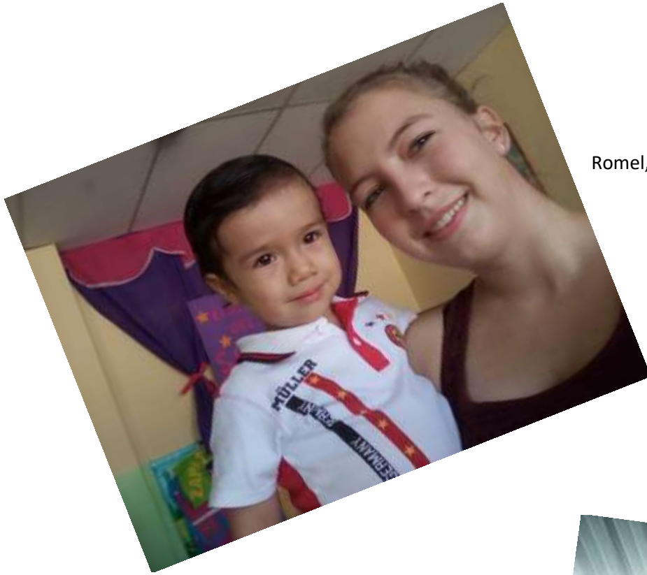
Romel, offensichtlich ein Müller-Fan, hihi.