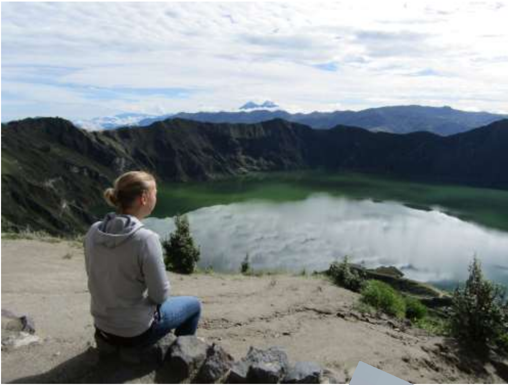
Die traumhafte Lagune von Quilotoa...

...ist auch spektakulär, wenn Wolken aufziehen!