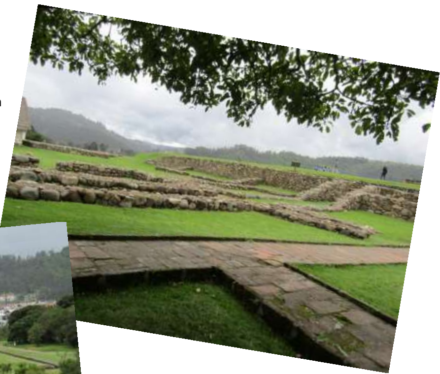
PumaPungo – Ausgrabungsstätte mitten in Cuenca